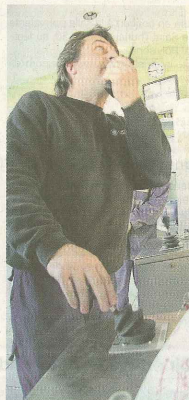
La tour de contrôle, d'où les opérateurs guident les sacs jusqu'au four et en contrôlent la combustion.