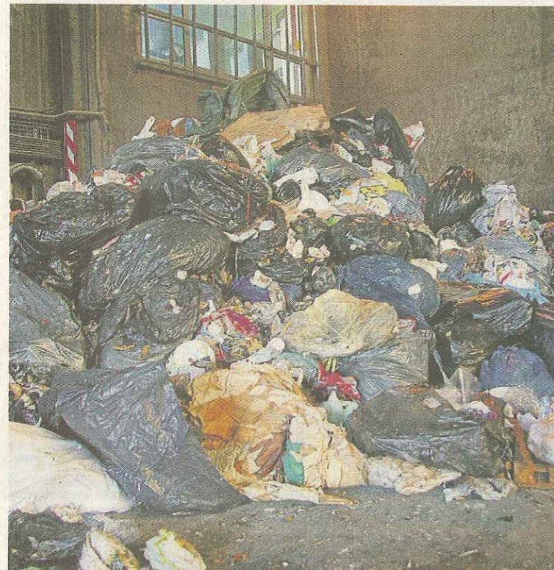
Les camions arrivent de tout le nord du département et déchargent leurs sacs poubelles qui ne tardent pas à rejoindre le four d'incinération qui tourne 24 heures sur 24.