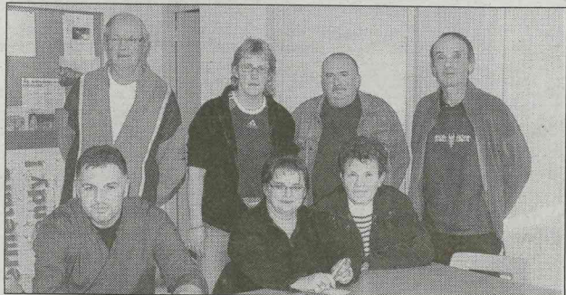
La soirée humoristique du 27 novembre, au palais des congrès, est organisée par l'Union locale CGT.

Philo, Roger, Maryline, Sidonie et Azalée... Tous les personnages déjantés de « La Bande à Philo » se produiront sur la scène du palais des congrès de Pontivy, le samedi 27 novembre, à partir de 20 h 30. Au programme: deux heures et demie de rires et de délires, menés à un rythme d'enfer dans ce spectacle qui cartonne sur toutes les scènes de l'Ouest. Tous les bénéfices de ce specta-