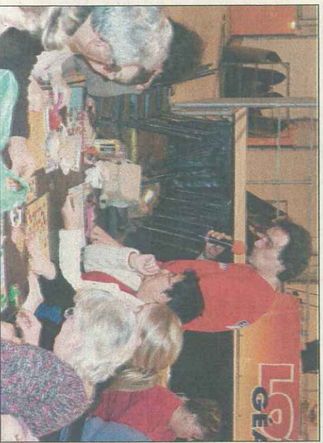
600 personnes ont tenté leur chance de remporter un des nombreux prix.

Le loto géant de carnaval organisé vendredi soir, à la halle Saiffe, par le Rugby-club pontivyen, n'aura finalement attiré que 600 personnes.